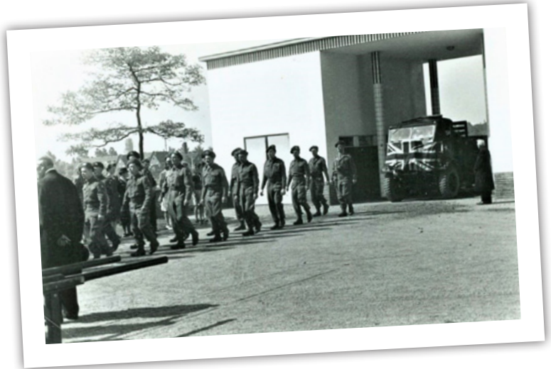
Vrachtwagens met de kisten en Britse vlag komen aan bij de Noorderbegraafplaats Hilversum.