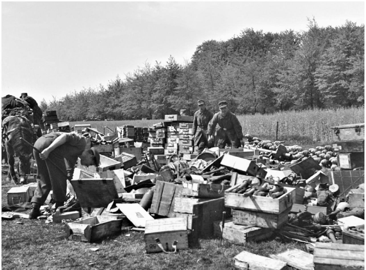
Foto genomen op 10 mei 1945 met nogal nonchalant opgestapelde munitie, deels in kisten, zoals handgranaten, Panzerschreck en Panzerfausten. De plek van de explosie zal een soortgelijk aanblik gehad hebben. Van het veld waar de explosie heeft plaats gevonden kwam na ons onderzoek een zelfde houten kistje gemerkt met 88 als in de foto op de voorgrond zichtbaar is. z.g.Patronenkasten 88; deze bevatte 1500 geweer- en MG-patronen.

Onderstaande foto is illustratief voor de situatie tijdens de ontwapening op de late namiddag van de 10de mei 1945.