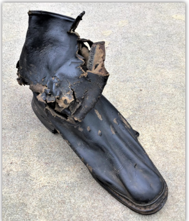
Duitse schoen met scherfschade. Collectie SLS 39-45.