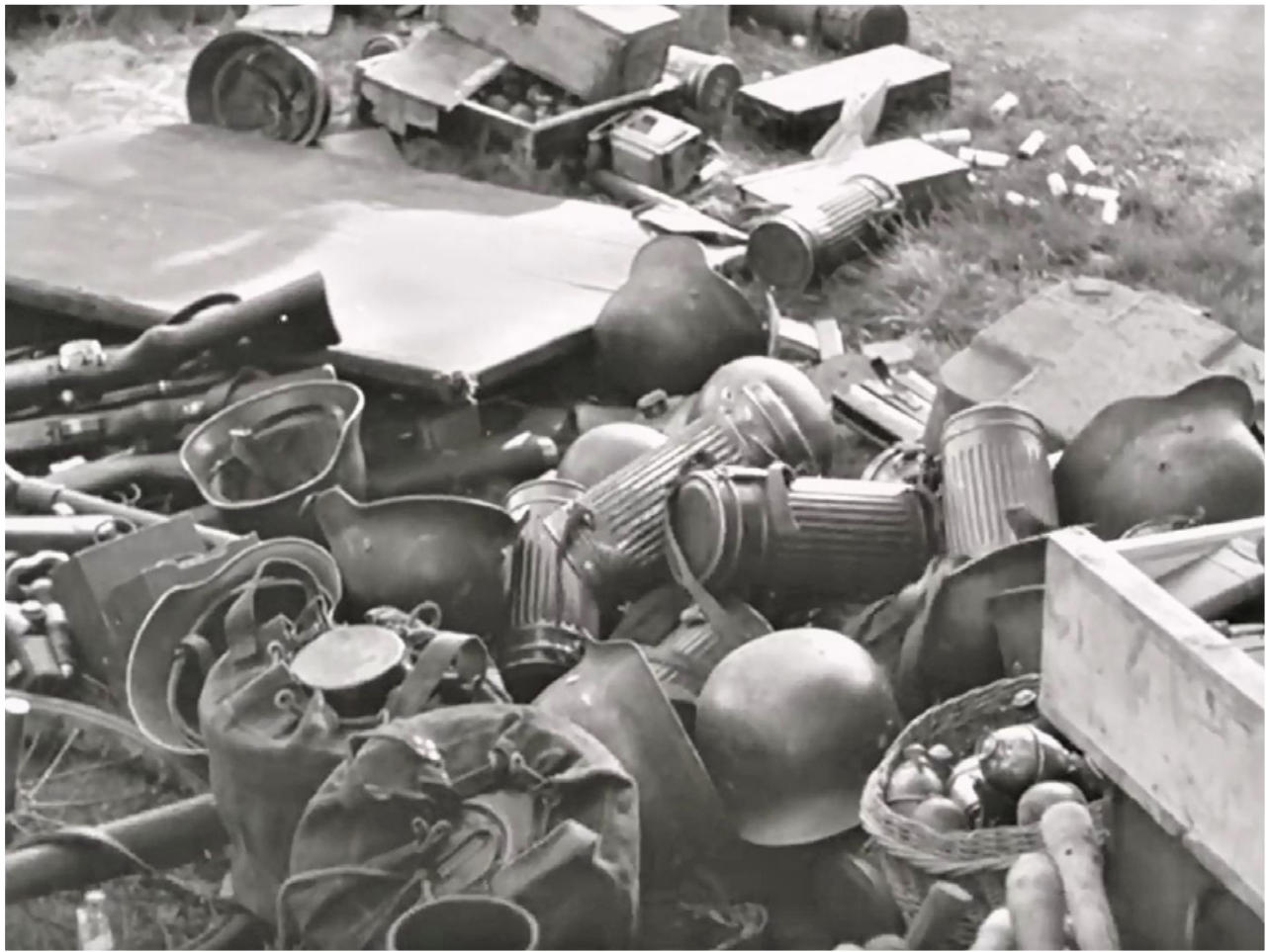
Foto uit filmfragment 10 mei 1945: Bestudering van gemaakte filmbeelden aan de Biltseweg laten zien dat het uitladen van materieel er opvallend ruw aan toe ging. Alles schots en scheef op en door elkaar gegooid waaronder ook veel handgranaten. Als daar gevoelige munitie of ontstekers tussen zaten dan is een explosie door ongelukkig gegooide spullen niet ondenkbaar....