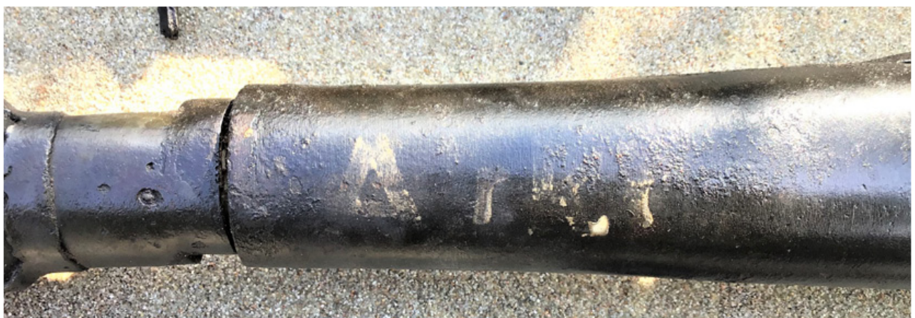
Foto R PzB Gr. 4322 Arkt (Arktisch) winter munitie.

8,8 cm R PzB Gr. 4322 ofwel 8,8 cm Raketten Panzer Büchse Granat 4322 (Panzerschreck- munitie).